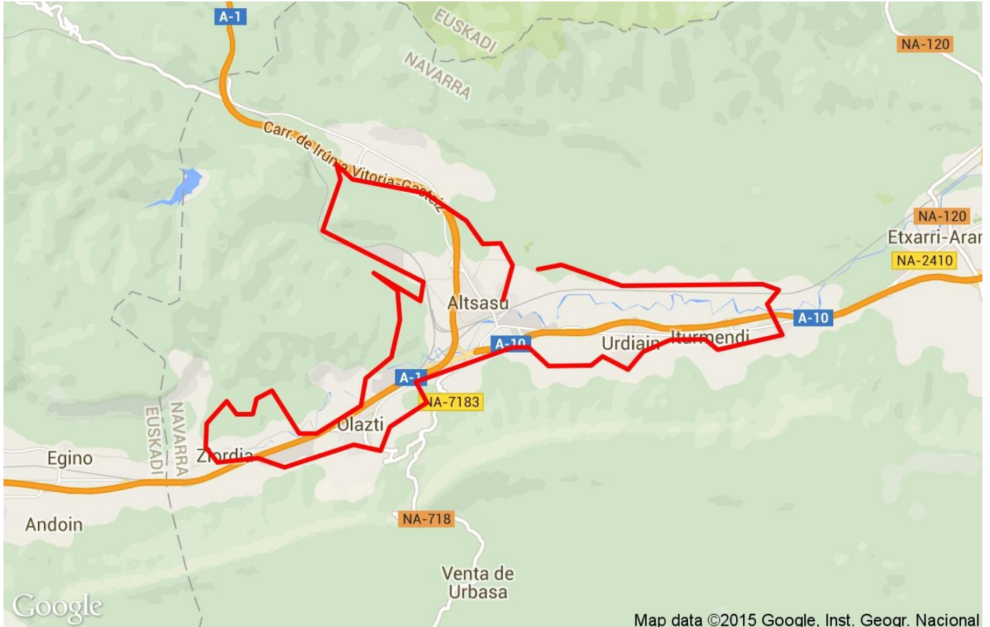
Map data ©2015 Google, Inst. Geogr. Nacional